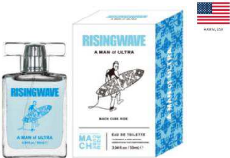
A MAN of ULTRA EAU DE TOILETTE (マッハ チューブ ライド)

ウルトラな海男のウルトラなサーフトリップ。ボード 1 枚で、世界中のどこまでも。 世界有数のサーフスポットでテイクオフ。