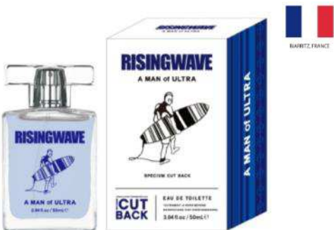
A MAN of ULTRA EAU DE TOILETTE (スペシウム カット バック)

TOP : グレープフルーツ、シトラスゼスト、 リーフイーグリーン、カシス MIDDLE : ミュゲ、フローラルブーケ LAST : セダーウッド、ムスク