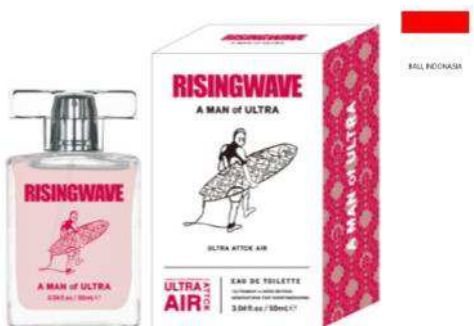
A MAN of ULTRA EAU DE TOILETTE (ウルトラ アタック エアー)

TOP : カシス、アップル、パイナップル、レモン MIDDLE : ジャスミン、ピーチ、ラフランス LAST : ムスク、アンバー、サンダルウッド