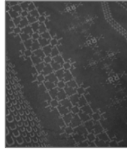
【柄アップ】 テキスタイルを “ULTRA”の文字で構成