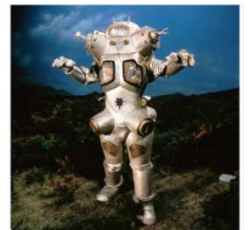
【キングジョー】 初登場作品:『ウルトラセブン』(1968 年)