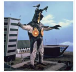
【ゼットン】 初登場作品:『ウルトラマン』(1967 年)