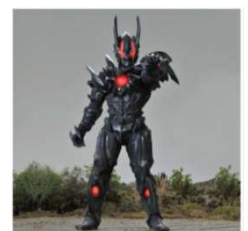
【ダークルギエル】 初登場作品:『ウルトラマンガイア』(2013 年)