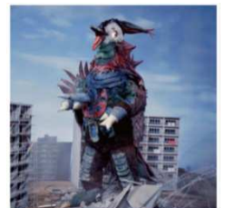
【ブラックピジョン】 初登場作品:『ウルトラマン A』(1972 年)