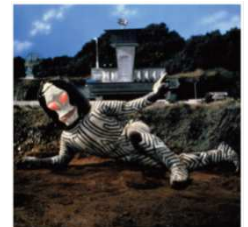
【ダダ】 初登場作品:『ウルトラマン』(1967 年)