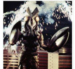
【バルタン星人】 初登場作品:『ウルトラマン』(1966 年)