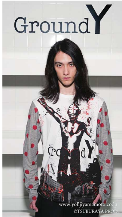
カットソー(ウルトラマン)