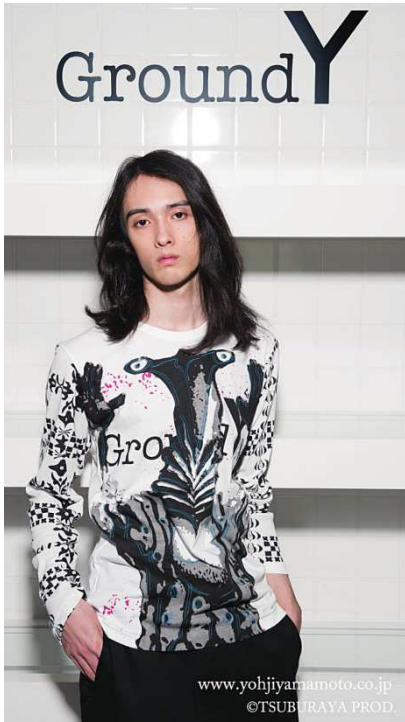
カットソー (ペガッサ星人)