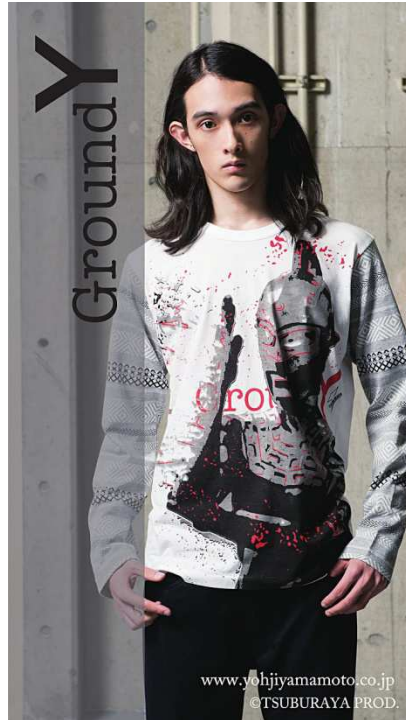
カットソー(ウルトラセブン)