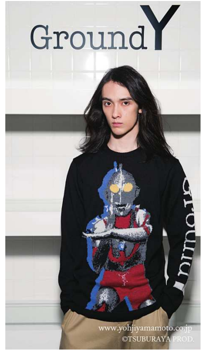
スペシャルニット(ウルトラマン)