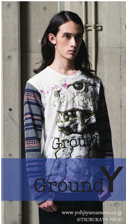
カットソー(レッドキング)