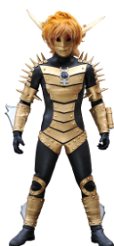
実写版ババルウ星人