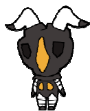
デフォルメキャラ ゼットン

作品中、必殺技・アイスラッガーをはじき返すなどセブンを圧倒した強敵を、「顔と全体のバランス」に注意してデフォルメ(ゲームプロデューサー談)。より一層人気が出ること間違いなし！