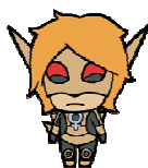
デフォルメキャラ ババルウ星人