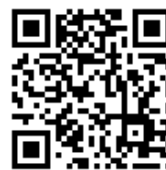
公式サイト QR コード

Google Play： https://play.google.com/store/apps/details?id=biz.fields.ulque