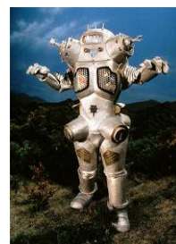
実写版キングジョー