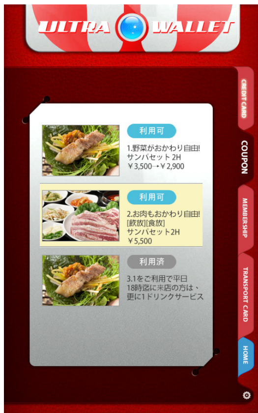
クーポン選択画面