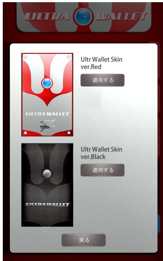
スキンセレクト画面