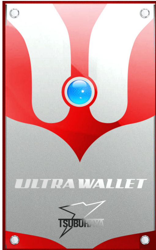
『ウルトラ・ワレット(仮称)』スタート画面