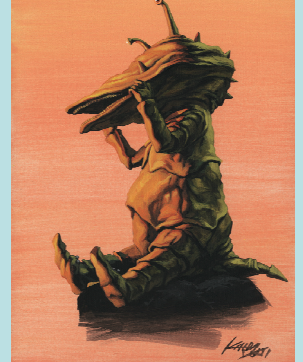
肉筆画の“カネゴン”