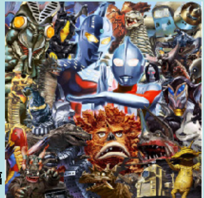
税込価格52,500円(受注販売)

各会場で、ファンから熱い支持を受ける好評企画第8弾! 開田裕治自らが貴方だけに1枚1枚丁寧に描き下ろす肉筆画を今回も発売! ゲット出来るのは20名の方のみ。今回の怪獣は、ウルトラQより“カネゴン”。