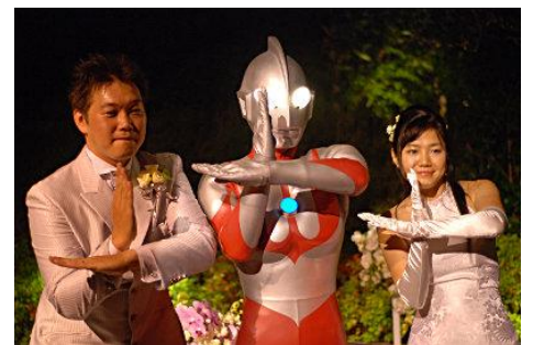
(イメージ写真)

大好きなウルトラマンと一緒になら、その思い出はさらに輝きを増すに違いありません。夢のようなひとときをお楽しみください!