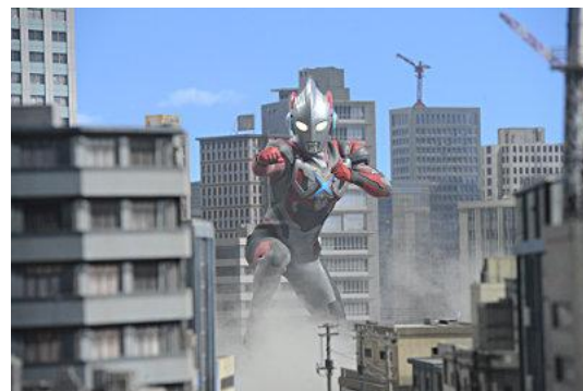
※写真は全てイメージです 実際の見学内容とは異なります