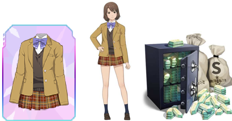
レナの制服 / 佐山レナ(制服) / スペシウム