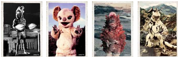
円谷プロ 大怪獣カード(全6種)