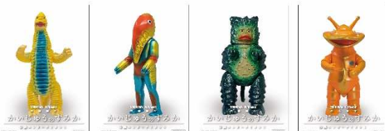
平日限定「かいじゅうソフビシール」イメージ