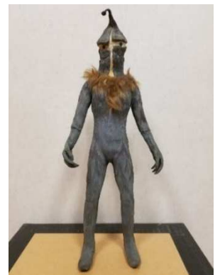
参考写真：高山良策作 制作品