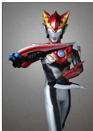
※「ループスラッガーロツソ」を持つ ウルトラマンロツソ フレイム。

かつてウルトラセブンが戦いの時に手にした「アイスラッガー」を彷彿とさせるこの武器は、二人の頭部の形状の通り、兄・ウルトラマンロツソは長短2本の刃で戦う「二刀流」、弟・ウルトラマンブルは刃ひとつの大きな剣で戦います。ロツソのループスラッガーを「 ループスラッガーロツソ 」、ブルのそれを「 ループスラッガーブル 」と呼びます。斬撃はもちろん、突き攻撃や、剣先からの光線や光刃など、様々な攻撃方法を使って襲い来る敵と戦います。