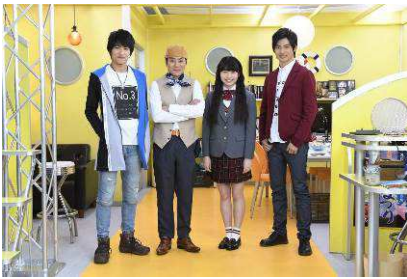
湊家「クワトロM」店内にて