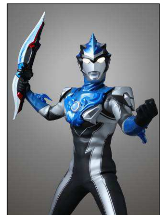
※「ループスラッガーブル」を持つ ウルトラマンブル アクア。