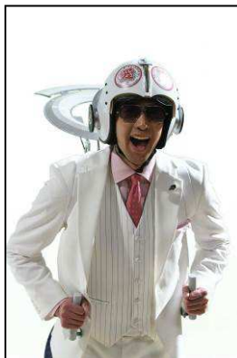
社の技術を駆使する愛染