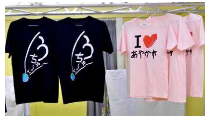
ウシオがデザインする独特なTシャツ