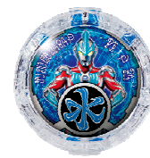
火のエLEMENTを宿した 「タロウクリスタル」 水のエLEMENTを宿した 「ギンガクリスタル」