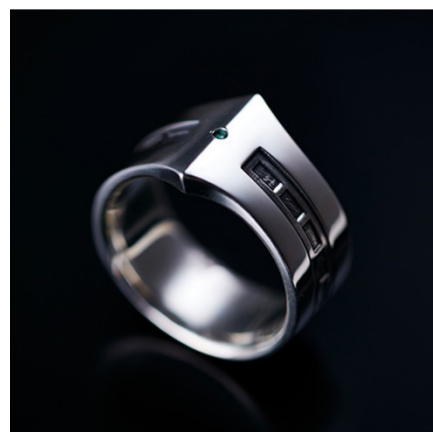
PUERTA DEL SOL(西武池袋本店先行販売) ウルトラセブンリング TYPE-1(エメラルド) 19,000円(税抜)