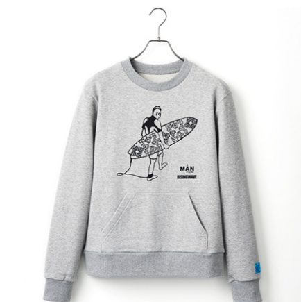
A MAN of ULTRA サーフスウェット 14,000円(税抜)