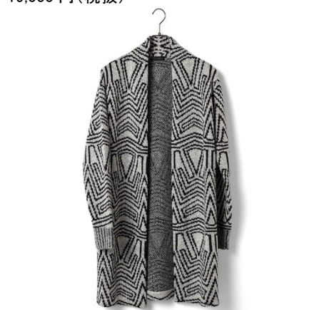
TETE HOMME ニットガウン(ダダ) 24,000円(税抜)