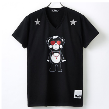
TANTA(西武池袋本店先行販売) グリッターTシャツ 22,800円(税抜)