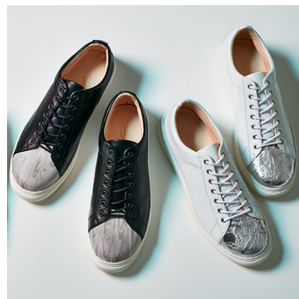
Bluestone(西武池袋本店先行販売) レザースニーカー(墨流し/アルミ型押し) 各 59,000円(税抜)