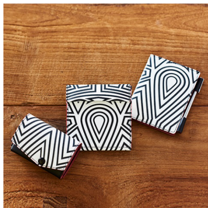
abrAsus 小さい財布/薄い財布/薄いメモ帳(ダダ) 13,889円/16,852円/ 7,222円(税抜)