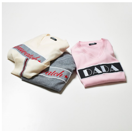
LOVELESS カシミアセーター(shuwatch/DADA) 各 33,000円(税抜)