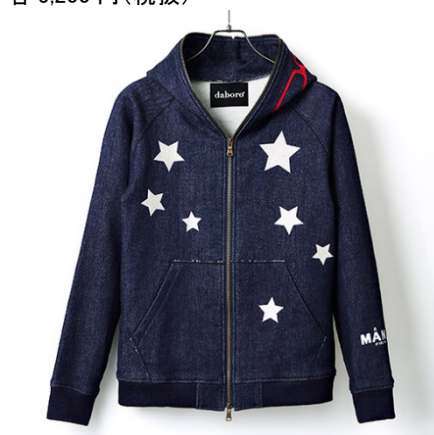
daboro デニム風パーカー(ウルトラセブン) 35,000円(税抜)