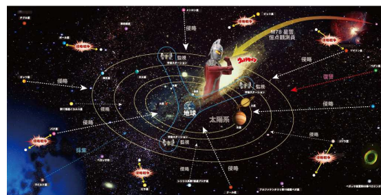
宇宙マップ イメージ

ウルトラセブンが 地球を守るきっかけとなった危機。「遊星間侵略戦争」は、宇宙でどのように起こっていたのか。本企画展用に制作した宇宙マップで説明します。