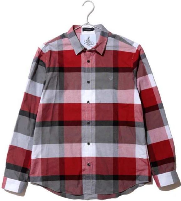
ULTRA クレストブリッジシャツ 20,000 円