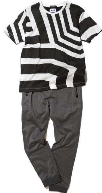
T シャツ : 10,000 円、パンツ : 16,000 円