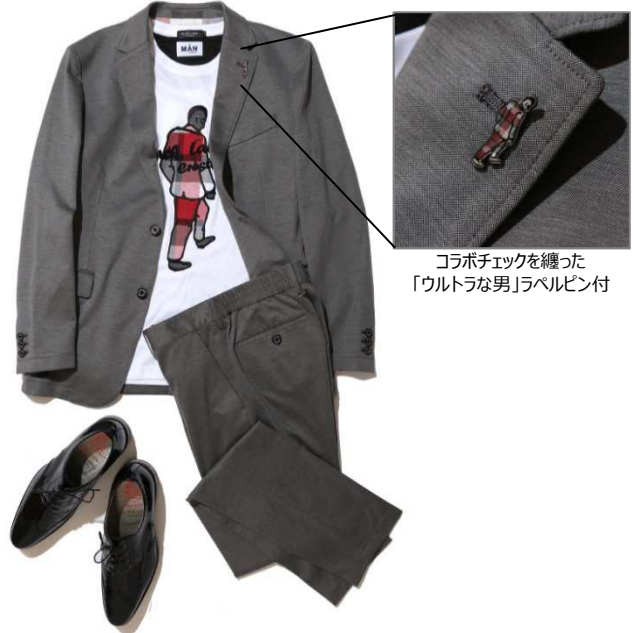
コラボチェックを纏った 「ウルトラな男」ラベルピン付