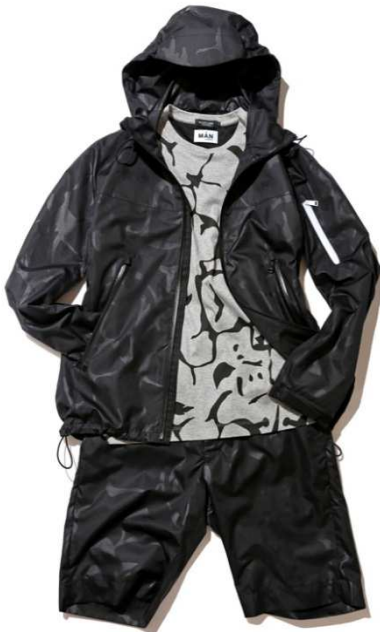
パーカー : 36,000 円、T シャツ : 10,000 円 パンツ : 16,000 円