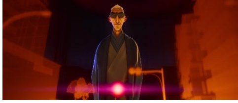
怪獣防衛隊（KDF）指揮官・オンダ博士