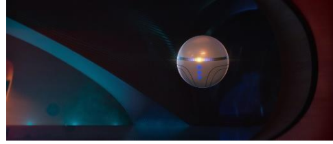
ケンの世話をするスーパーコンピューターのミナ